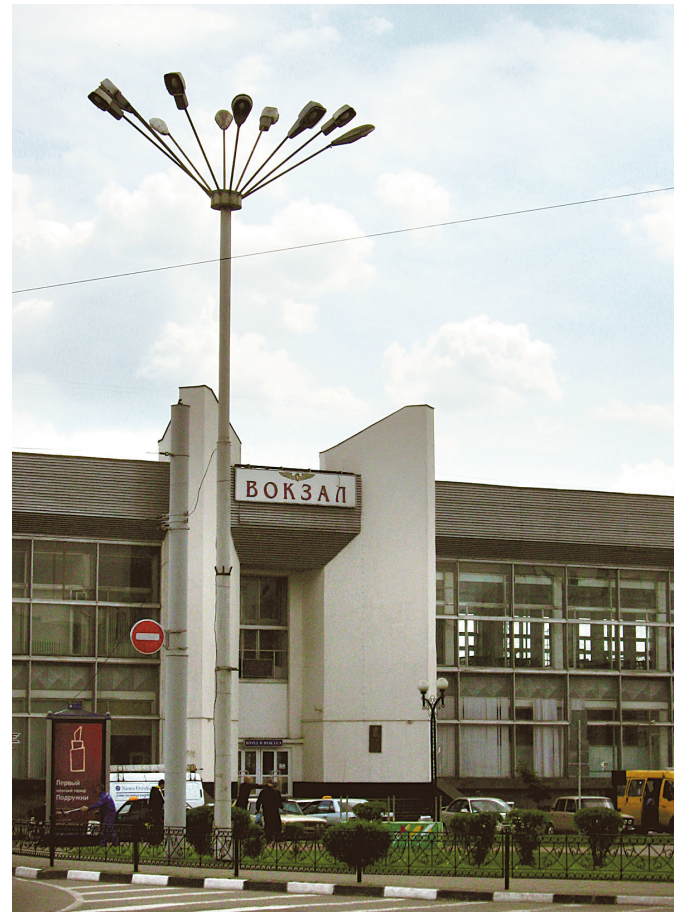
Проектируя вокзал, архитекторы не учли того, что и в южном Белгороде бывают холодные зимы

Коснётся реконструкция и внешнего вида здания – рабочие капитально отремонтируют кровлю