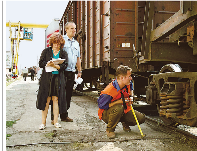
Бумажная работа и визуальный поиск неисправностей уходят в прошлое

Сведения о проделанной работе передаются на следующий по ходу поезда ПТО, работники